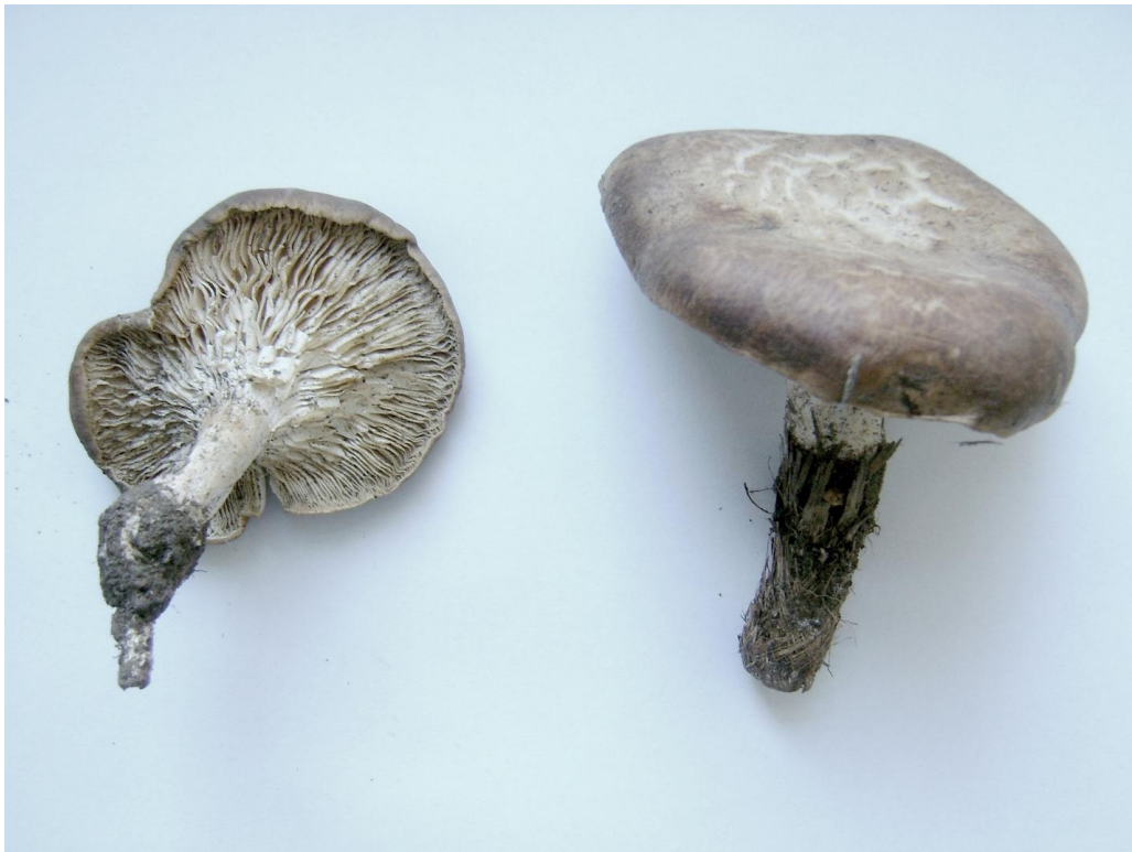
Рис. 4. Зрілі плодові тіла Pleurotus eryngii