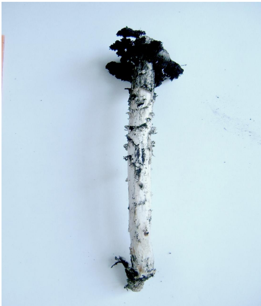
Рис. 3. Плодове тіло Montagnea candollei

У складі деревно-кущових насаджень та залишків байрачних лісків у парку виявлено 16 видів грибів, в основному ксилотрофів, мікоризних і, частково, гумусових сапротрофів. Серед них досить часто траплялися Auricularia auricula-judae , Entoloma clypeatum , Polyporus squamosus , Trametes hirsuta , Phellinus igniarius , Schizophyllum commune та ін.