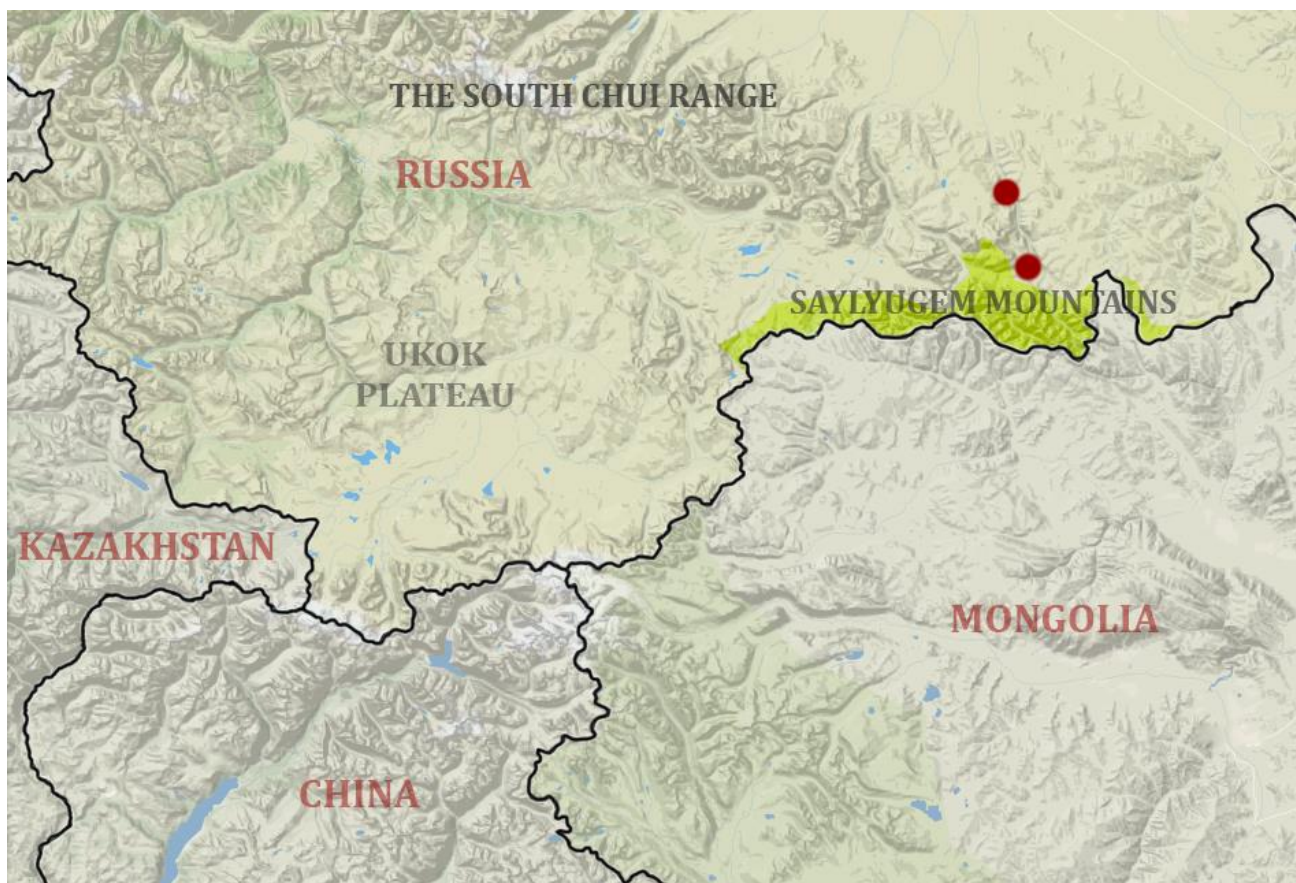
Рис. 1. Местоположение национального парка 'Сайлюгемский' с отмеченными местами сбора материала.